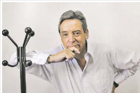
AMENAZA. "La reconstrucción puede convertirse en un gran negocio".

Durante veinte años, Carlos Ominami fue una de las figuras más influyentes de la política chilena. Fue Ministro de Economía durante el gobierno de Aylwin y luego senador por el Partido Socialista, al que renunció el año pasado en apoyo de la candidatura de su hijo, Marco Enríquez Ominami, quien también abandonó la Concertación, la coalición de centroizquierda que gobernó Chile desde el regreso de la democracia y que perdió el poder recientemente a manos de Sebastián Piñera, representante del ala más liberal de la derecha.